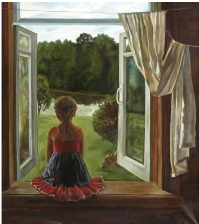
«Лето в деревне», 1985 год

1) Рассмотрите картину С. Нечитайло «Лето в деревне» и ответьте на вопросы: