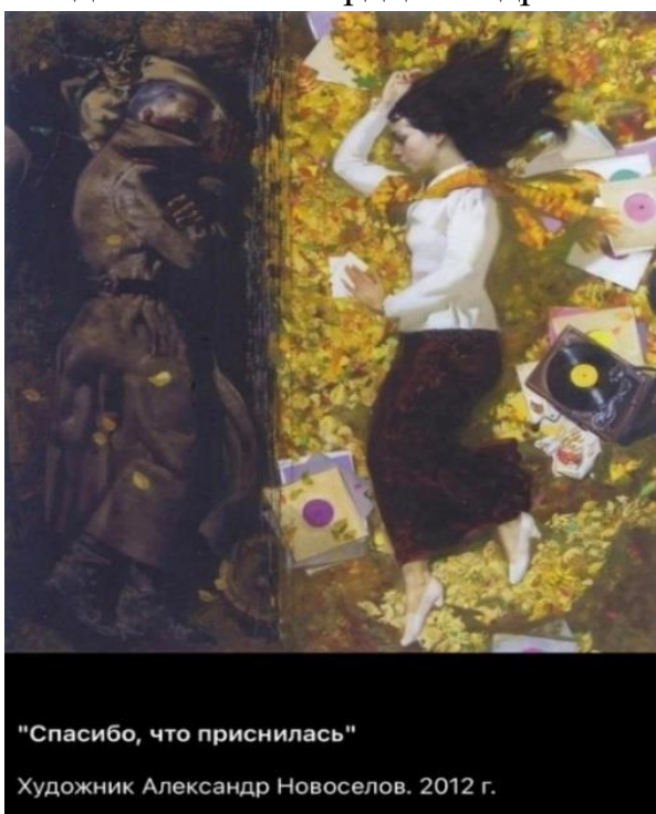
"Спасибо, что приснилась" Художник Александр Новоселов. 2012 г.

Приведем пример «творческой десятиминутки» с разбором картины российского художника Александра Новосёлова «Спасибо, что приснилась», написанной в 2012 году. Картина не оставляет никого равнодушным и всегда находит отклик в сердцах подростков.