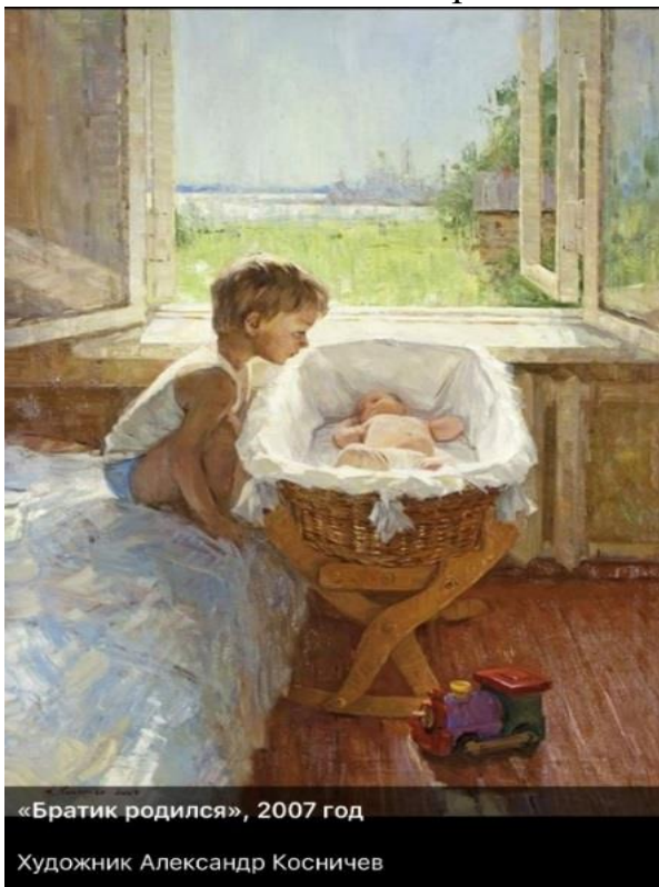
«Братик родился», 2007 год Художник Александр Косничев

Какой пейзаж открывается из окна спальни? Что в этом пейзаже привлекает ваше внимание?